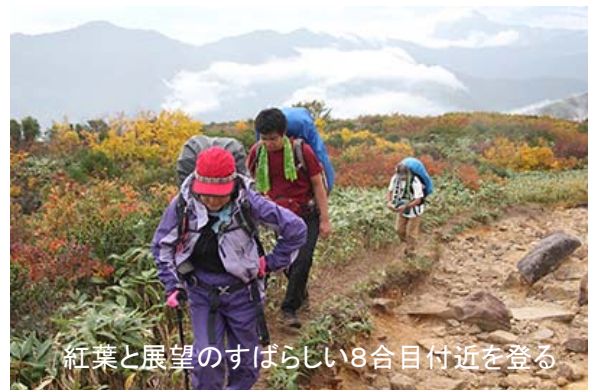
紅葉と展望のすばらしい8合目付近を登る

登山口から1時間20分。昭文社のコースタイムどおり、五合目に到着。山頂の稜線と米子沢の流れがよく見える。別パーティーの二人がうどんを作っていた。我々も昼食タイムとする。