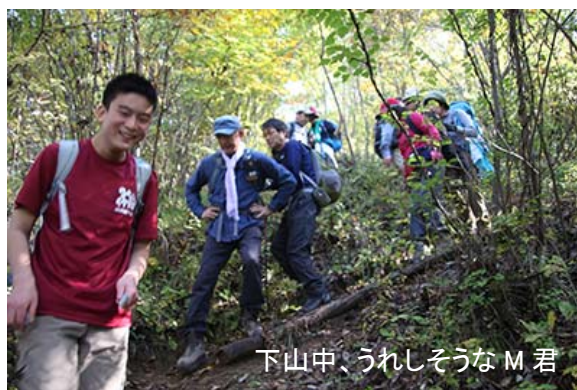
下山中、うれしそうなM君