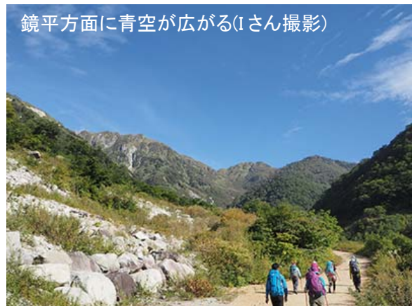
鏡平方面に青空が広がる

すばらしい天気の下で、さらに林道を歩く。苔むした岩の上を小さな沢の水が流れている。1/8 秒程度の遅いシャッター速度で、手持ち撮影する。どうしてもぶれてしまうが、水の流れを白い線で表現するには、そのくらいのシャッター速度でないと難しい。