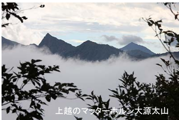
上越のmatterホルン大源太山

六日町の駅に着くと雨が降り始めた。私はザックから雨具を出そうとするが、雨具が見当たらない。雨具をザックに入れ忘れたのだ。他の人たちに迷惑をかけるので、3人で行ってもらい、私はこのまま引き返そうと考えた。しかし、みなさんから、せっかく新幹線まで使ったここまで来たのに、帰るのはもったいないということで、雨具を購入して山に行くことにする。タクシーでイオンまで行き、10時の開店を待って雨具を購入し、タクシーで登山口まで行く。