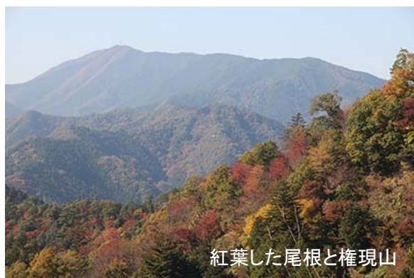
紅葉した尾根と権現山

八重山を過ぎた頃から紅葉が美しくなる。赤や黄色に色づいた木々を楽しみながら登る。登り着いた能岳は展望はない。「この山に登った人は脳が良くなる」という言い伝えがあったのだろうか？ 期待しないが、できるだけ脳は劣化しないでほしいところだ。