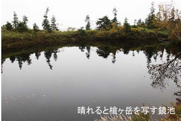
晴れると槍ヶ岳を写す鏡池