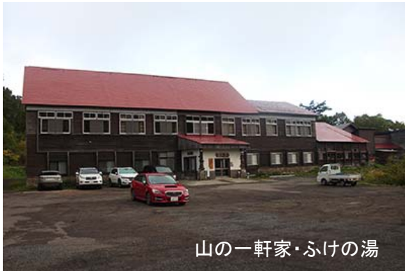
山の一軒家・ふけの湯

ふけの湯の野天風呂を見ながら歩いて行く。野趣満点で、次に来たときには必ず入ることにしよう。