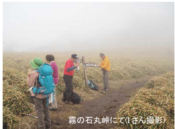
霧の石丸峠にて

尾根は次第に急になり、登りが続くようになる。今日一番の登りだ。玉蝶山（なんと読むのだろうか？）の山頂脇を通り、さらに登りが急になる。再び霧に包まれながらも、尾根の上に分岐を示す標識が現れた。石丸峠手前の小金沢山方面への分岐だ。草原の石丸峠は展望が良いはずだが、今日は霧で何も見えない。しかも風が吹いてきて寒いので、早々に出発する。その前にタクシー会社に電話して、福ちゃん荘までタクシーを依頼する。