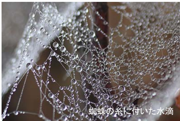
蜘蛛の糸に付いた水滴

小菅の湯に下る分岐（山沢入りのヌタ）から、一番左の登山道を歩く。しばらくトラバースし、大マテイ山山頂への分岐を過ぎてさらに歩く。少し開けた大ダワで昼食タイムとする。霧の日は何も風景が見えないが、蜘蛛の糸には無数の水滴が付いて美しい。遠くの見えない日は、近くにある美しいものを探そう。