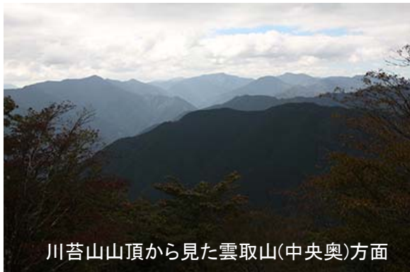
川苔山山頂から見た雲取山(中央奥)方面

歩きやすい道を上って山頂に到着すると、雲取山方面の展望が広がる。みんなが見たいだろうと思う方角にある木を伐採したのだろう。富士山方面も切られていた。しかし、今日は富士山は見えない。