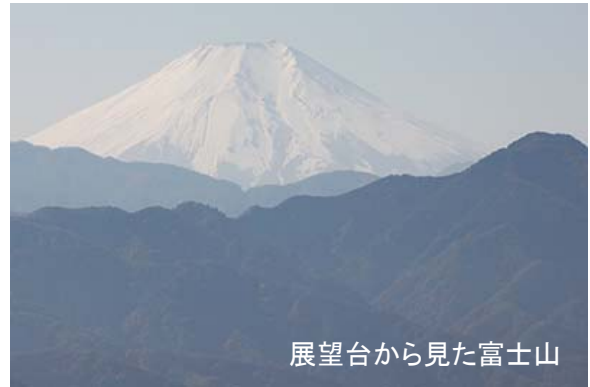
展望台から見た富士山

さらに登っていくと階段が現れ、展望の良さそうなところが見えてくる。しっかりとした五角形の屋根のある展望台に到着。五感を働かせるために五角形なのだそう。