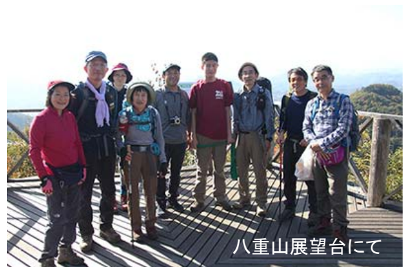
八重山展望台にて

さらに登っていくと階段が現れ、展望の良さそうなところが見えてくる。しっかりとした五角形の屋根のある展望台に到着。五感を働かせるために五角形なのだそう。