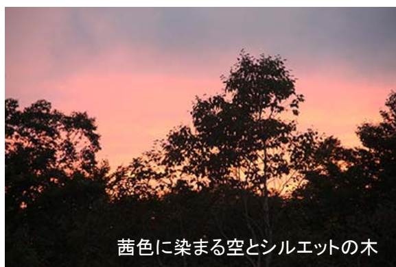
茜色に染まる空とシルエットの木

美しさに感動して歩いていると、左側に車道が見えてきた。そして、ようやく車道に飛び出した。女性陣はみんな抱きついて喜んでいる。予想に反して厳しかった道を乗り越えてきたことへの感動だろう。とにかく無事に山道を終えて良かった。