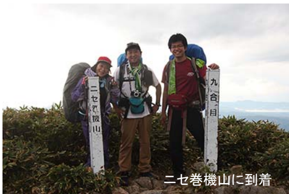
二七巻機山に到着

この頃から雨がポツポツ降り出した。私は新品の雨具を身につける。しかし、雨具を付けると暑い。雨はすぐに止んだので雨具の上着を脱ぐ。七合目を過ぎ、さらに登ると、次第に木々の高さが低くなる。少し登ると、紅葉のきれいな場所に出る。展望もすばらしい。ここが八合目だった。谷川岳や一ノ倉岳は雲に隠れていたが、とがった万太郎山がよく見える。仙ノ倉山と平標山は雲に隠れていた。その時は気がつかなかったが、帰宅後調べたら、苗場山も見えていた。