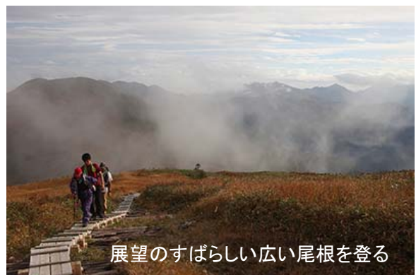
展望のすばらしい広い尾根を登る

明日は雨になる可能性が高いので、少々時間的には遅いが、今日のうちに山頂を往復することにする。避難小屋にシュラフやコンロなどを置き、軽い荷物で山頂に向かう。少し上がると、展望はさらに広がる。柄沢山方面にかかる滝雲もよく見え、その向こうには朝日岳、笠ヶ岳が見えていた。池塘を過ぎ、さらに一登りすると割引岳との分岐に出る。そこに山頂標識があった。一応、ここで集合写真を撮ることにする。山頂の反対側には、越後三山がよく見えていた。ただ、そちら側はどんよりと雲がかかっていた。